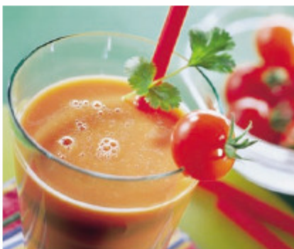
Tomatensaft – schmeckt nicht nur im Flugzeug.