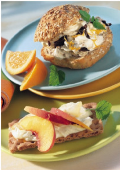
Mit einem leckeren Frühstück beginnt der Tag voller Energie.