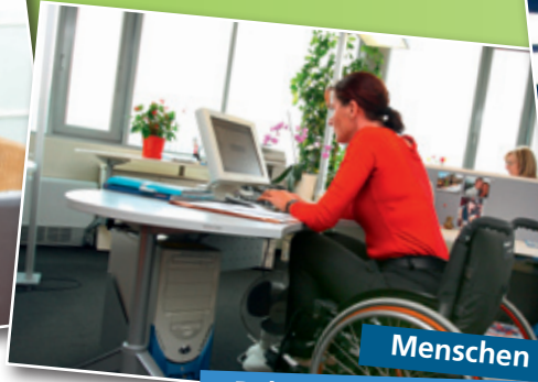
Menschen mit Behinderung integrieren