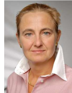
Ansprechpartnerin für das Fachprogramm