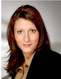
Ansprechpartnerin für Aussteller und Organisation

Bitte wenden Sie sich bei allen Fragen und Anmerkungen zum Messekongress sowie bei Interesse an Ausstellungs- und Präsentationsmöglichkeiten an: